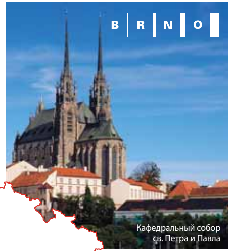
Кафедральный собор св. Петра и Павла

Город гордится достопримечательными памятниками, свидетельствующими о его богатой истории – крепость Шпилберк, кафедральный собор св. Петра и Павла, Старобрненский монастырь, Капуцинская гробница, Старая ратуша и много других. Наиболее известный памятник современной архитектуры – вилла Тугендхат – с 2001 г. внесен в Список культурного наследия ЮНЕСКО ( www.brno.cz ).