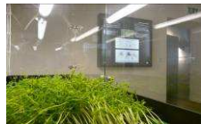
Mendel Museum www.mendelmuseum.muni.cz