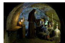
Znaimer Untergrund www.znojimocity.cz