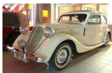
Technisches Museum in Brunn www.technicalmuseum.cz