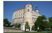
Regionalmuseum in Mikulov www.rmm.cz