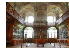
Gedenkstätte des Schrifttums in Mähren, Rajhrad www.muzeumbrnenska.cz