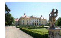
Schloss Austerlitz