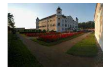
Schloss Milotice www.zamekmilotice.cz