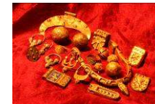
Slawischer Burgwall in Mikulčice www.mikulcice-valy.info