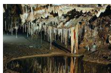
Mährischer Karst www.cavemk.cz