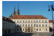
Mährisches Landesmuseum- Dietrichstein Palais www.mzm.cz