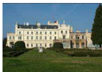
Schloss Lednice www.zamek-lednice.com