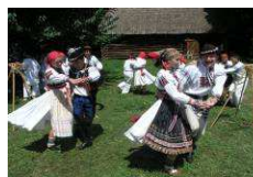
Freilichtmuseum Strážnice www.nulk.cz