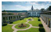
Schloss Lysice www.zameklysic.cz