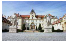
Schloss Valtice und Salon der Weine www.zamek-valtice.cz www.salonvin.cz

EUROPEAN TERRITORIAL CO-OPERATION AUSTRIA-CZECH REPUBLIC 2007-2013 Gemeinsam mehr erreichen. Společně dosáhneme více.