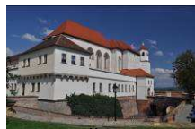
Burg Špilberk www.spilberk.cz