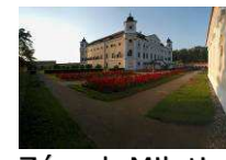
Zámek Milotice www.zamekmilotice.cz