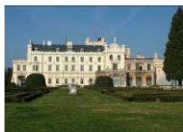
Zámek Lednice www.zamek-lednice.com