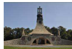
Mohyla míru www.muzeumbrnenska.cz