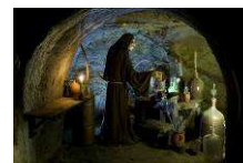
Znojenské podzemí www.znojnocity.cz