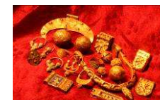
Slovanské hradiště v Mikulčicích www.mikulcice-valy.info