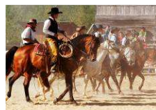
Western park Boskovic www.westernove-mestecko.cz