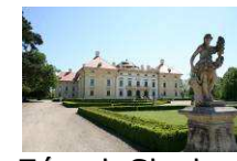
Zámek Slavkov- Austerlitz www.zamek-slavkov.cz