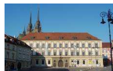
Moravské zemské muzeum- Dietrichsteinský palác www.mzm.cz