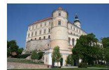
Regionální muzeum v Mikulově www.rmm.cz