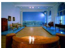
Uměleckoprůmyslové muzeum www.moravska-galerie.cz