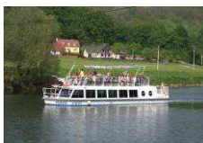
Bařův kanál www.batacanal.cz