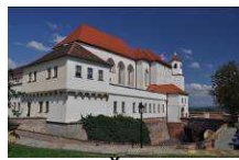
Hrad Špilberk www.spilberk.cz