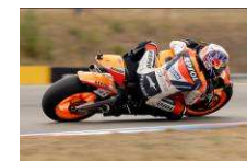
Automotodrom Brno www.brno-circuit.com