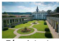
Zámek Lysice www.zameklysice.cz