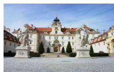
Zámek Valtice und Salon vín ČR www.zamek-valtice.cz www.salonvin.cz

EUROPEAN TERRITORIAL CO-OPERATION AUSTRIA-CZECH REPUBLIC 2007-2013 Gemeinsam mehr erreichen. Společně dosáhneme více.