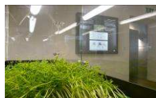
Mendelovo muzeum www.mendelmuseum.muni.cz