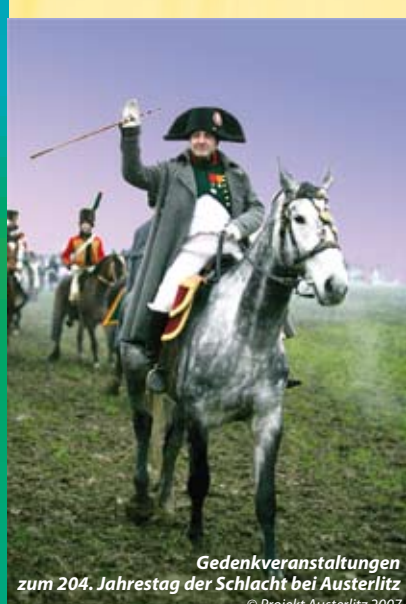
Gedenkveranstaltungen zum 204. Jahrestag der Schlacht bei Austerlitz